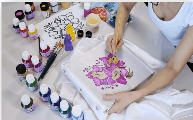
Нанесение рисунка вручную

Модернизация существующих фабрик. Создание рабочих мест на заводах и фабриках РФ.