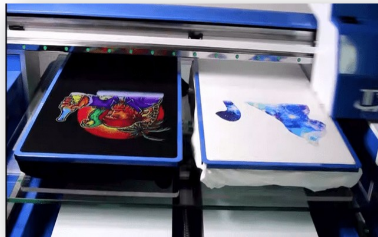
Модернизированный станок 3D печати